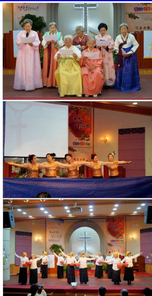
찬 문화제 참가자격을 받아 교회를 대표 해 출전하는 영애를 얻었다. <문화부장>