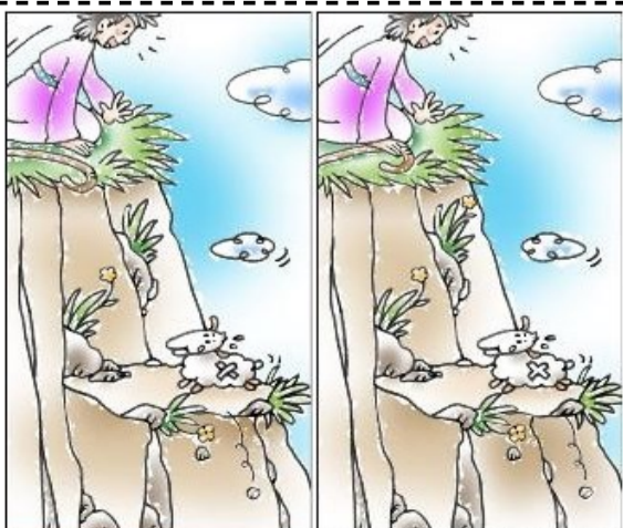
다른 곳을 찾아라! (5곳) 양 알백 마리 중 하나가 길을 잃으면 길 잃은 양을 찾지 않겠느냐 만일 찾으면 길을 잃지 아니한 아흔 아홉 마리보다 더 기뻐하리라 [마 18: 12~13]